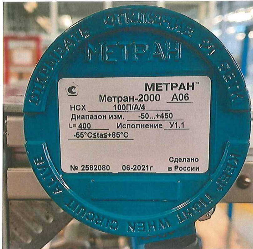
Рисунок 1.2 – Маркировка термопреобразователя сопротивления Метран-2000