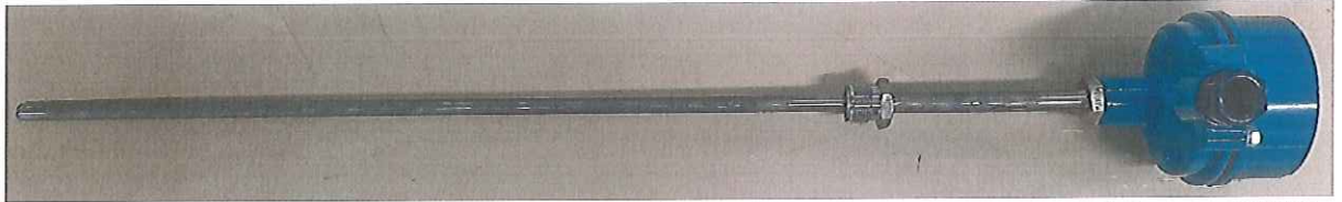
Рисунок 1.1 – Внешний вид термопреобразователя сопротивления Метран-2000

Фотографии общего вида средства измерения