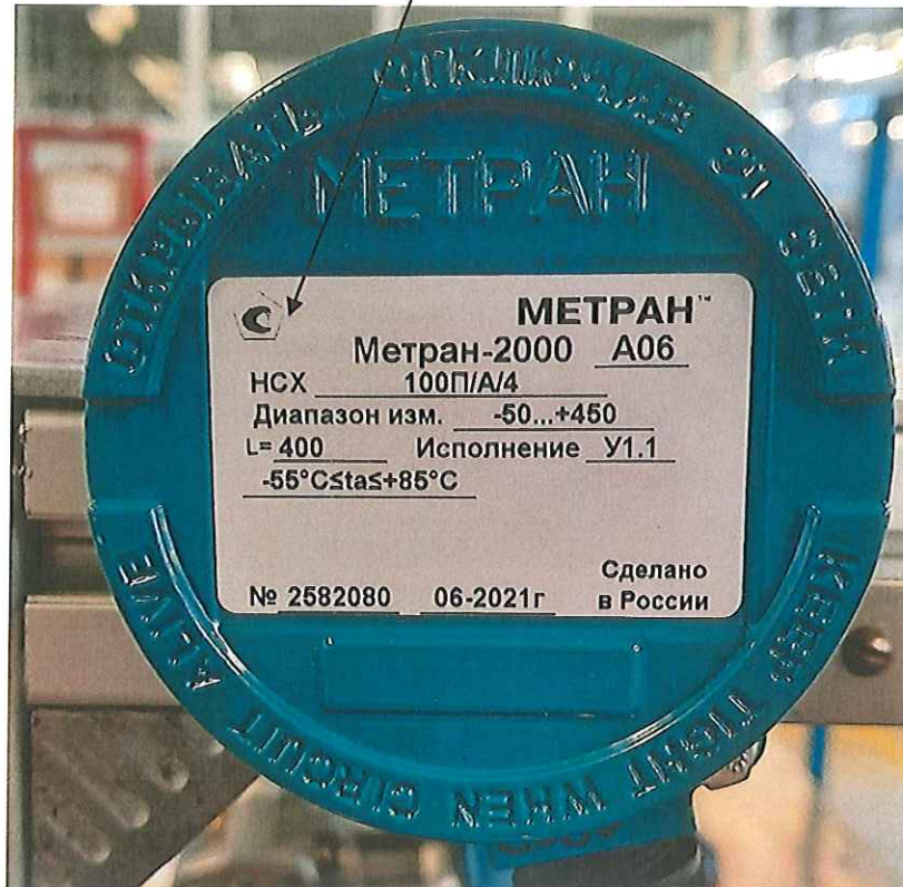
Рисунок 2.1 - Место нанесения знака поверки в виде клейма-наклейки

Место нанесения знака поверки (клеймо-наклейка)